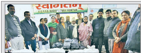
रोहतक। गवर्नमेंट स्कूलों में गरम जर्सी व जूते वितरित करने आए महाराजा अग्रसेन सेवा सदन ट्रस्ट के पदाधिकारी।