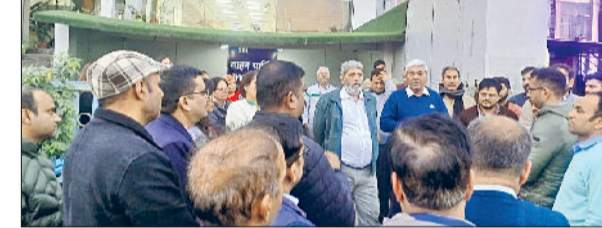
रोहतक। अपनी मांगों के लिए प्रदर्शन करते बैंक कर्मचारी।