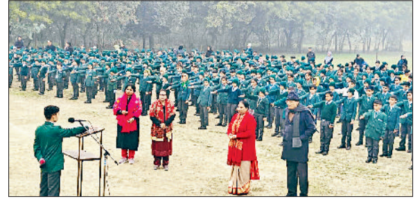
रोहतक। ग्रीनलैंड स्कूल में नशा मुक्त की शपथ लेते विद्यार्थी।

देनी है। सभी के जीवन में सुख, शांति, स्वास्थ्य, सफलता सदा साथ रहे और अपने कर्मों को हम श्रेष्ठ बनाते हुए चलें। नए साल पर कुछ नया करना ही है तो किसी राते हुए को हंसाएं। किसी रुठे को मनाएं। किसी टूटे को सहाया दें। गलत करने वाले को भी माफ करें। जो है उसे संभालें और जो आने वाला है उसे श्रेष्ठ बनाएं। बीता हुआ साल हमें बहुत कुछ सीख देकर गया है। कई हमने खुशियां पाईं तो कहीं दर्द और तो कहीं संघर्ष। लेकिन आज का दिन हमें यह सिखाता है कि जो बीत गया उससे बोझ नहीं समझना। अनुभवों से आगे बढ़ना है। कोई रो रहा है तो उसकी मुस्कान बनना है। कोई रुठा है तो उसे मना लेना है। कोई सहारा चाहते हैं तो उनका सहारा बनना है। अपने व्यवहार में शुद्धता लाना है। हमारा परिवर्तन ही हमारे नव वर्ष की शुरुआत है।