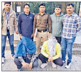
रोहतक। आरोपित पुलिस की गिरफ्तार में।

जिले में अपराध पर अंकुश लगाने के उद्देश्य से चलाए जा रहे ऑपरेशन हॉटस्पॉट डोमिनेशन के तहत रोहतक पुलिस को बड़ी सफलता हाथ लगी है। पुलिस टीम ने गश्त के दौरान मोटरसाइकिल सवार दो युवकों को अवैध हथियार सहित गिरफ्तार किया है। आरोपियों के कब्जे से एक देसी पिस्तौल और कुल छह जिंदा रौंद बरामद किए गए हैं। पुलिस ने दोनों आरोपियों के खिलाफ शस्त्र अधिनियम के तहत थाना सांभला में मामला दर्ज कर आगे की कानूनी कार्रवाई शुरू कर दी है। दोनों आरोपियों को गिरफ्तार कर अदालत में पेश किया गया, जहां से उन्हें नियमानुसार न्यायिक प्रक्रिया में भेजा गया।